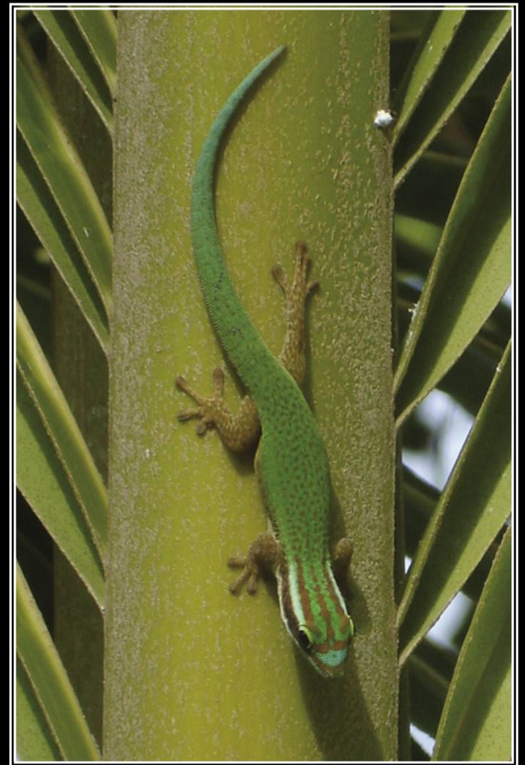
Gecko vert de Manapany sur une feuille de cocotier

Les tarse des geckos sont composés de petites lamelles adhérentes leur permettant de grimper sur toutes les surfaces, même verticales.