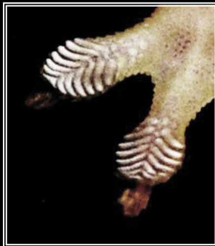
Exemples de lamelles adhérentes

Les lamelles adhérentes sont particulièrement efficaces sur les surfaces lisses comme les murs des maisons ou les bambous.