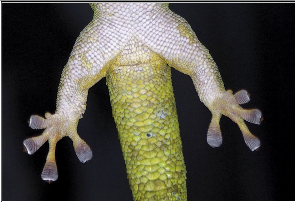
Pattes de gecko vert

Les geckos sont principalement arboricoles. Ils sont adaptés à se déplacer sur les surfaces lisses.