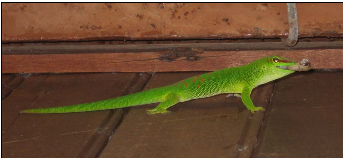
Photo 1 : Phelsuma grandis prédatant un gecko nocturne, Gehyra mutilata (Sainte Suzanne)

Par ailleurs, ce grand gecko est potentiellement porteur de parasites et/ou de maladies qu'il pourrait transmettre à P. inexpectata ( PM ).