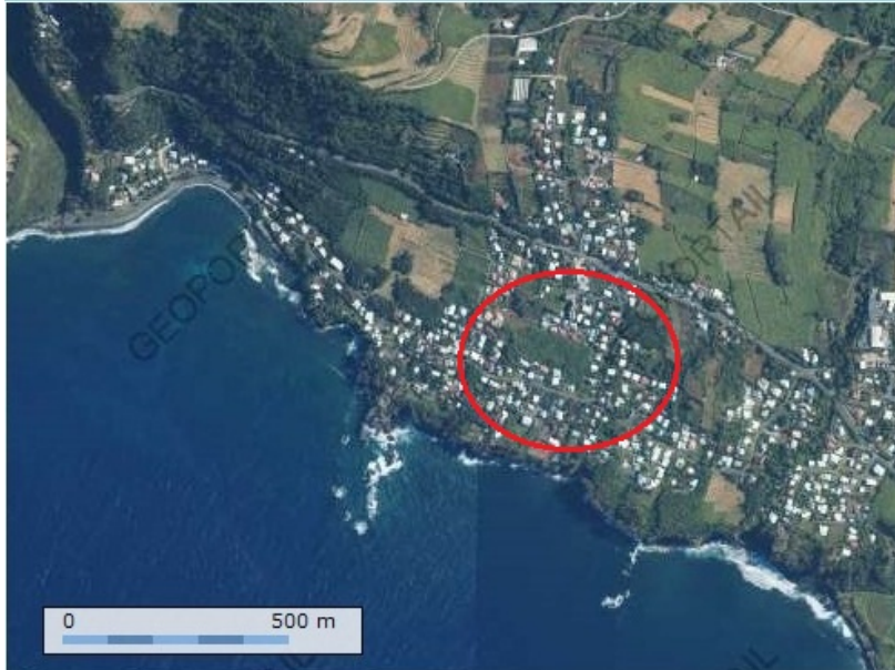
Carte 1 : Localisation du site d'étude (Carte IGN Géoportail)

Le site d'étude est localisé à l'est de la plage de Manapany-les-Bains et au sud de la Nationale 2. Il comprend la rue M. Luther King, le boulevard de l'Océan, l'impasse Pipenguaye, le lotissement CAPS et quelques chemins privés.